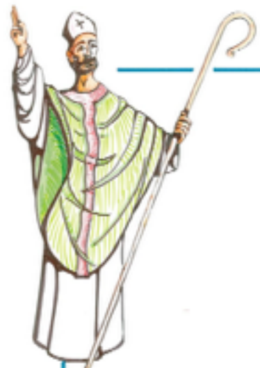
(Dibujo de San Froilán y rotulación regional de D. Jesús Cacho Gómez, «69-12»)