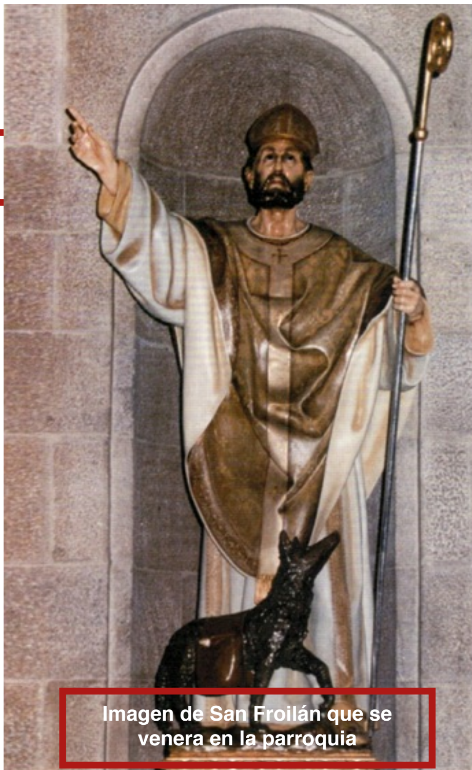
Imagen de San Froilán que se venera en la parroquia

Es patrono de las diócesis de León y Lugo, y titular de la parroquia lucense que lleva su nombre.