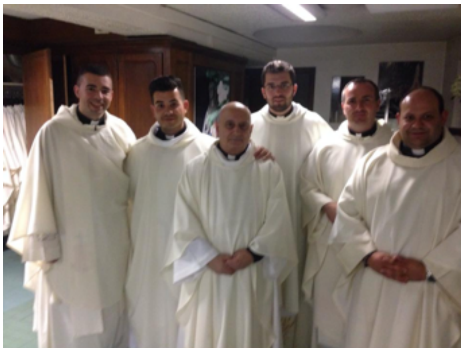
Sacerdotes de Lugo que participaron en la peregrinación

https://www.youtube.com/watch?v=hQ35T4fD7xs